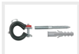
Bevestigende halsbanden Colliers de fixation