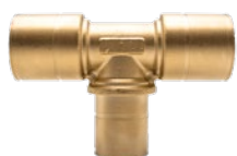
T-koppelingen Réduit Té