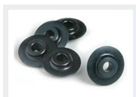
Reserve messen Lames de rechange